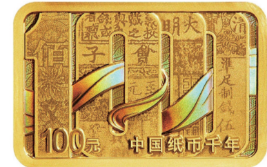
8克长方形金质纪念币背面图案