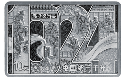
30克长方形银质纪念币背面图案

该套纪念币由上海造币有限公司和深圳国宝造币有限公司铸造,中国金币集团有限公司总经销。感兴趣收藏购买的市民可通过中国金币网(www.chngc.net/qd)或“中国金币”微信公众号详见具体销售渠道。