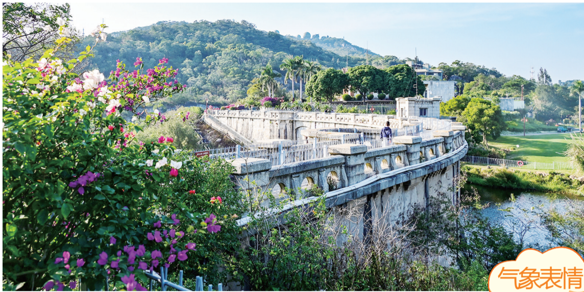
放晴 拍客Sunny摄于上李水库