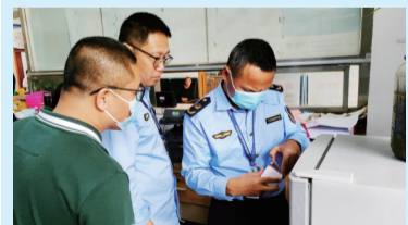
执法人员对诊所进行检查。

翔安区市场监管局表示，下一步，将持续关注医疗诊所药械使用管理情况，深入开展“清规”专项行动，加大对违法违规行为的查处力度，对发现问题的医疗机构进行“回头看”，确保整改到位，保障人民群众使用安全、有效的药品和医疗器械。