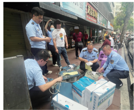
海沧区市场监管部门对一家健康咨询服务部进行突击检查。

执法人员提醒，近年来，一些具有养生保健、康复作用的家用医疗器械受到青睐，一些疗效诱人的广告、健康讲座、体验式服务等吸引老年人的眼球。广大老年人要保持清醒，提高警惕性和辨别力，守护好自己的“钱袋子”。