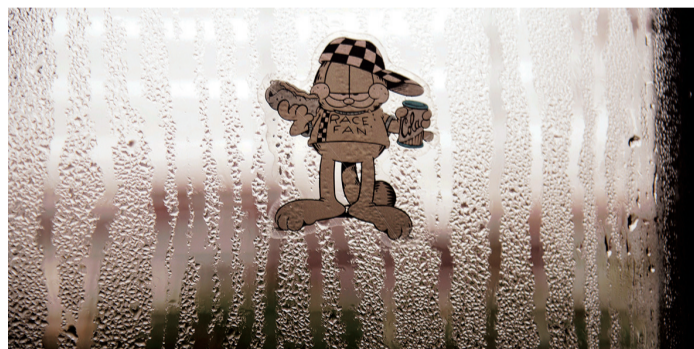
昨天“回南天”,地板、墙壁都湿漉漉的。

这次“回南天”何时缓解?气象专家告诉记者,今天白天还会有点潮湿,不过,今天夜里,预计我市转为东北风,东北风就像“干燥剂”,在其作用下,“回南天”就可以缓解。