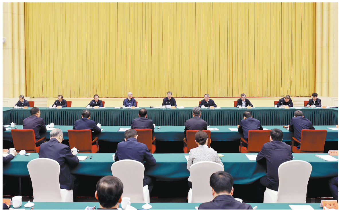
化国家新征程。同时要看到，西部地区发展仍面临不少困难和挑战，要切实研究解决。习近平强调，要坚持把发展特色优势产业

听取大家发言后，习近平发表了重要讲话。他指出，党中央对新时代推进西部大开发形成新格局作出部署5年来，西部地区生态环境保护修复取得重大成效，高质量发展能力明显提升，开放型经济格局加快构建，基础设施条件大为改观，人民生活水平稳步提高，如期打赢脱贫攻坚战，同全国一道全面建成小康社会，踏上了全面建设社会主义现代化国家新征程。同时要看到，西部地区发展仍面临不少困难和挑战，要切实研究解决。习近平强调，要坚持把发展特色优势产业作为主攻方向，因地制宜发展新兴产业，加快西部地区产业转型升级。强化科技创新和产业创新深度融合，积极培养引进用好高层次科技创新人才，努力攻克一批关键核心技术。深化东中西部科技创新合作，建好国家自主创新示范区、科技成果转化示范区。