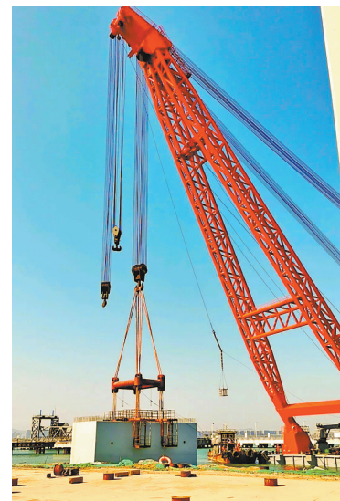
厦门奥林匹克体育中心岸壁及停车场项目沉箱安装基本完工。图为最后一个吊装的沉箱。

本报讯(文/图 记者 邵凌丰)凤翔新城建设传来最新消息——随着最后一个沉箱昨日精准下海安装,厦门奥林匹克体育中心(以下简称“厦门奥体中心”)岸壁及停车场项目沉箱安装基本完工,这也标志着两中心片区的岸壁工程已全部围合。