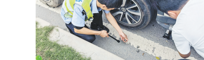
交警化身“维修工”帮换备胎。

本报（记者 房舒 通讯员 于鲁川 许凯旋）“没事，我们帮你看下！”4月13日下午4时，在翔安大道东坑路段，一车主因车辆轮胎发生故障报警求助，翔安公安分局交警大队民警化身“维修工”，给了他满满的安全感。