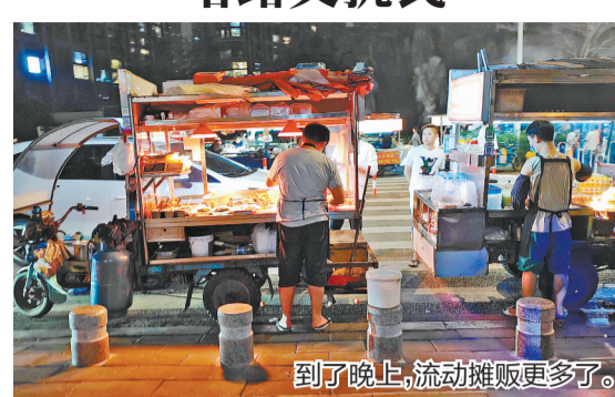
到了晚上，流动摊贩更多了。文/图 本报记者 房舒 4月13日，记者在同安阳光小镇门口发现，这一紧邻环岛浪漫线地方，一到下午和晚上，竟成了诸多流动摊贩的“据点”。

离开前，民警细心叮嘱驾驶员不能长时间使用备胎，要尽快更换标准轮胎再上路行驶。“谢谢你们，在我无助的时候，给了我满满的安全感。”分别前，车主对民警、辅警表达了由衷的谢意。