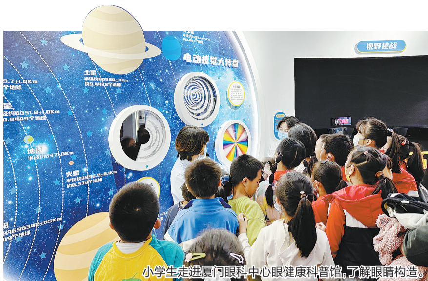
小学生走进厦门眼科中心眼健康科普馆,了解眼睛构造。