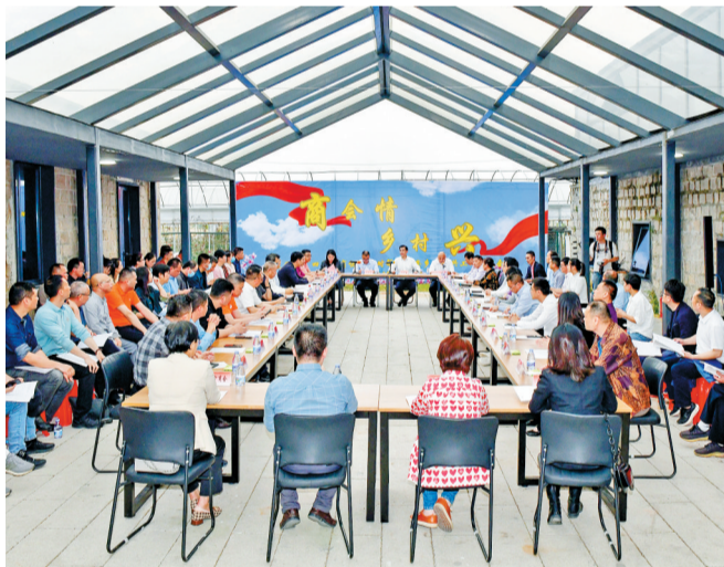
厦门市“四好”商协会结对帮扶同安乡村振兴工作座谈会在五显镇三秀山村召开。

同安是厦门农村范围最广、农业占比最大、农民数量最多的行政区,是全市农业农村现代化的主战场、乡村振兴的主阵地。去年6月以来,市委组织部、市工商联推动31家市“四好”商协会结对帮扶全市31个行政村,其中25家市“四好”商协会结对帮扶同安片区。