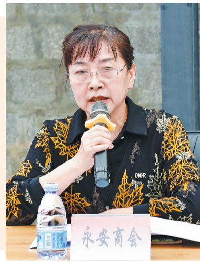
座谈会上,商协会代表畅所欲言。