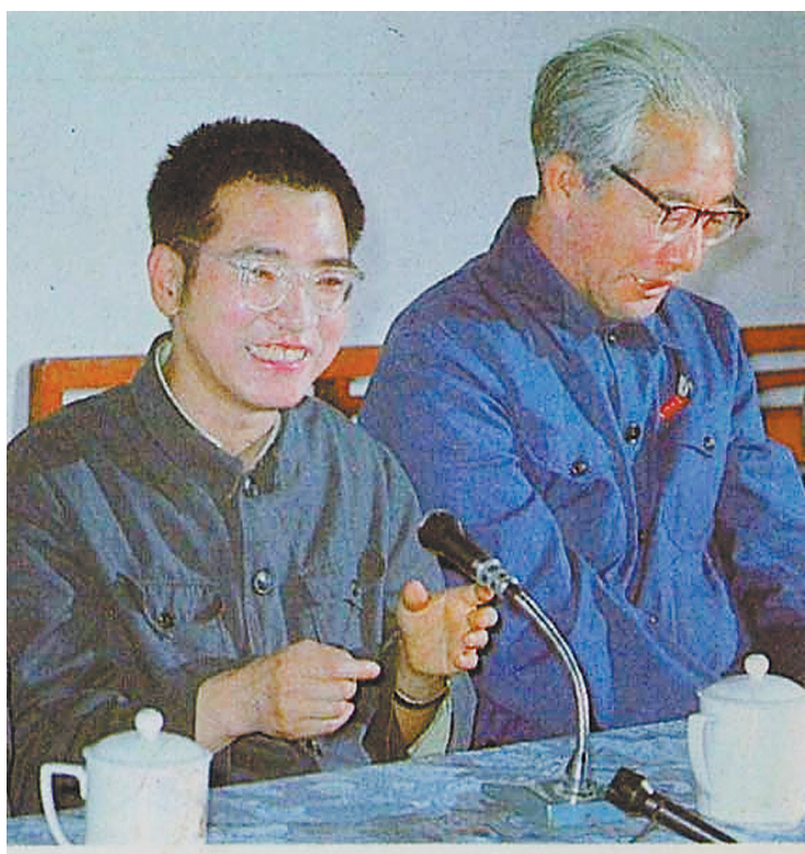
▲陈景润(左)和他在厦大的老师李文清。

本报讯(记者 余峥 通讯员 戴佩琪)厦门大学数学学科100岁了!昨天,九位中国科学院院士,校友陈景润的夫人,儿子出席厦门大学数学学科创建100周年发展大会。