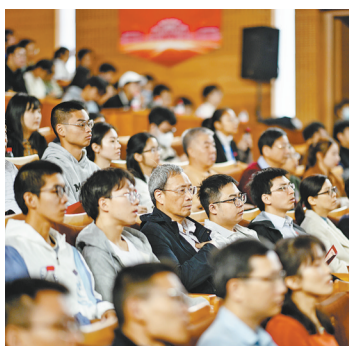
▲厦门大学数学学科创建100周年发展大会。

昨举行发展大会,九位院士、陈景润妻儿等出席 培养了四位院士 被誉为东南的数学花朵