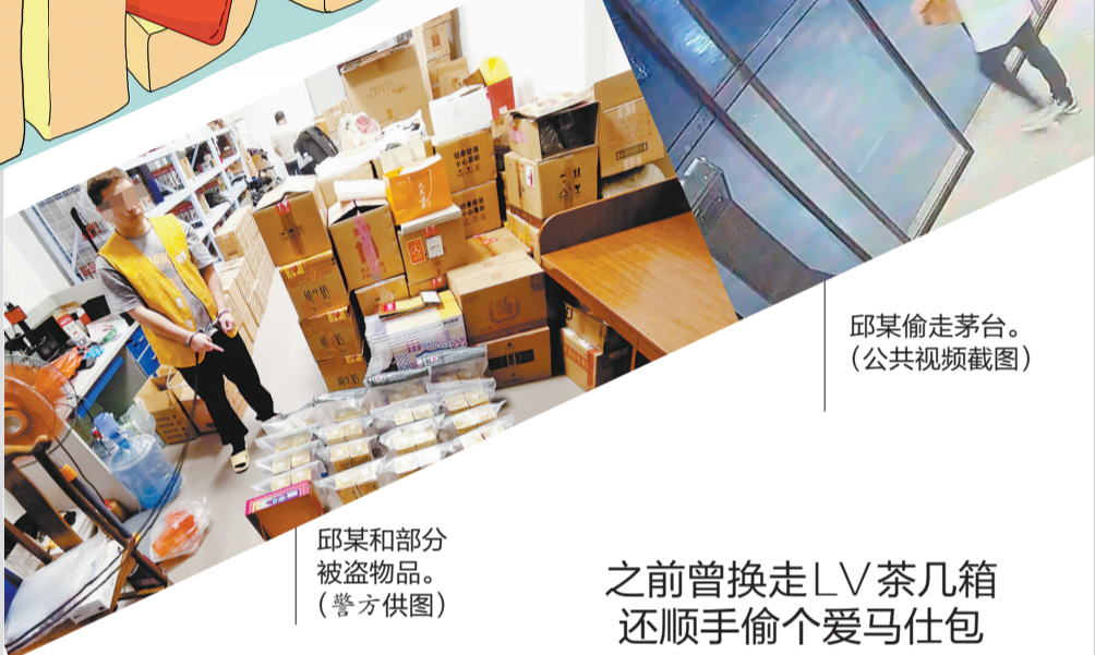
邱某偷走茅台。(公共视频截图)